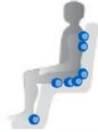
کرسی پر بیٹھنا