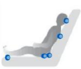
بستر پر بیٹھنا

نیچے دیے گئے خاکے میں وہ جگہیں دکھائی گئی ہیں جن کا آپ کو باقاعدگی سے جائزہ لینا چاہیے۔ ہاٹ سپاٹ ایریاز [زیادہ خطرے والی جگہیں]، جن کی شناخت حلقوں سے ہوتی ہے، وہ جگہیں ہیں جہاں بے پریشر السر سب سے زیادہ ہو سکتا ہے۔